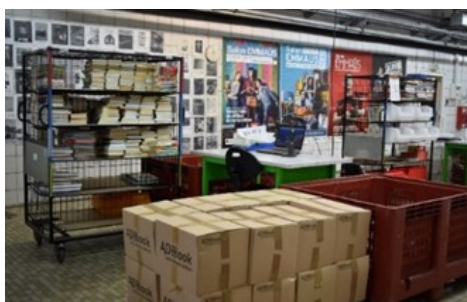
Zone d'enregistrement des livres