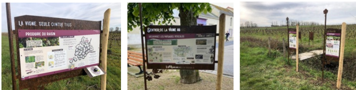
Haltes d'information et panneaux explicatifs à Loretz-d'Argenton

Ce projet présente un coût total de 63 772 € HT et a été financé par le FEADER à hauteur de 35 977,60 €.