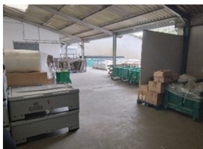
Quai de déchargement

Coût total du projet – 92 229 € HT. Aide européenne attribuée – 23 135 € de fonds FEADER.