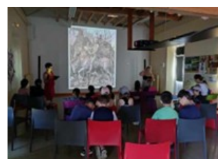
Utilisation de la micro-folie par des groupes scolaires : études et analyses de tableaux, photographies