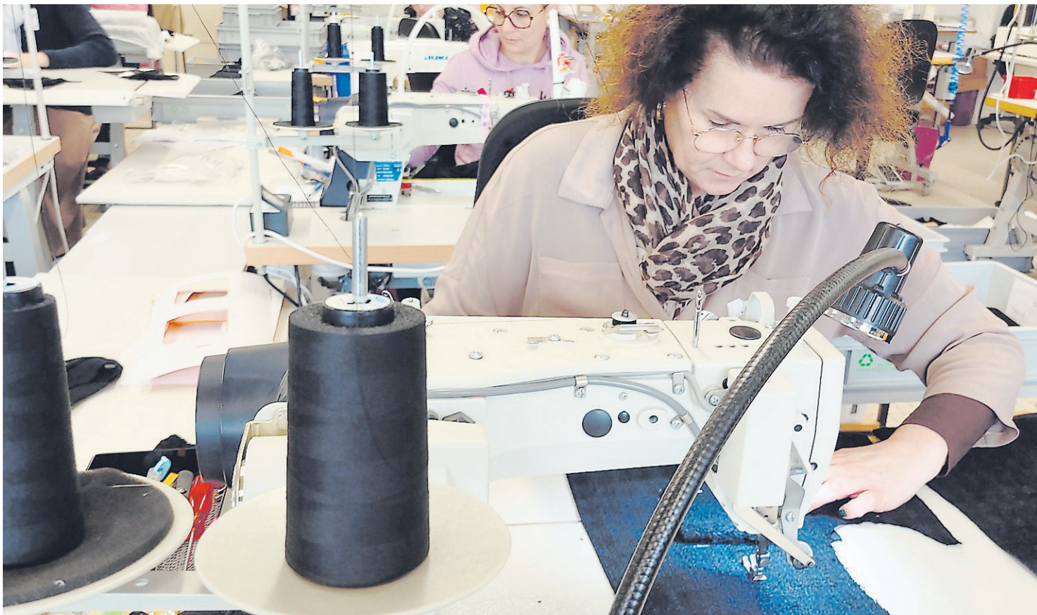
Chizé Confection travaille pour de prestigieux clients, comme Chanel, et veut former de nouvelles couturières.