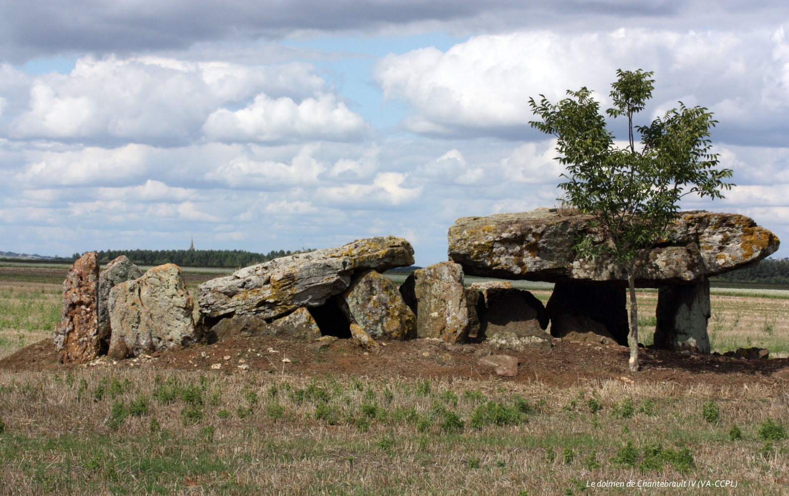
Le dolmen de Chantebrault IV (VA-CCPL)