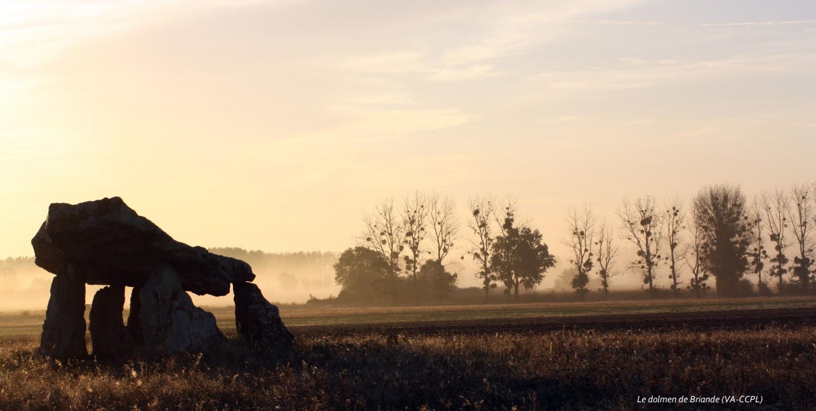
Le dolmen de Briande (VA-CCPL)