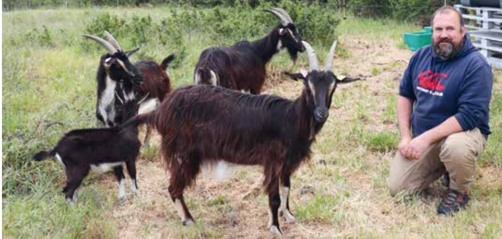
Wesley Fardeau a installé ses chèvres sur le site de la Vallée du Pressoir