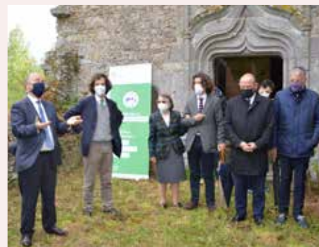
Lancement officiel du chantier par les propriétaires en présence notamment du Préfet des Deux-Sèvres, du Président de la Communauté de Communes, Maire de Thouars et des entreprises

Le château figure en bonne place dans le livret consacré à Glénay, édité par le Pôle culture de la Communauté de Communes, en partenariat avec le Service Patrimoine et Inventaire de la Région Nouvelle-Aquitaine sites de Limoges-Poitiers et en collaboration avec le service Architecture et patrimoine de la Ville de Thouars, dans la continuité du dispositif « Adoptez votre patrimoine ».