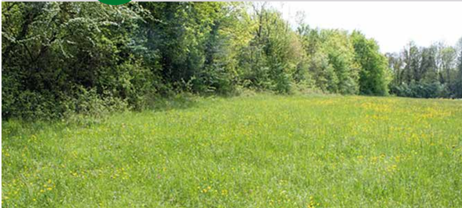
Prairie de fauche et haie bocagère avec une gestion préservant la biodiversité