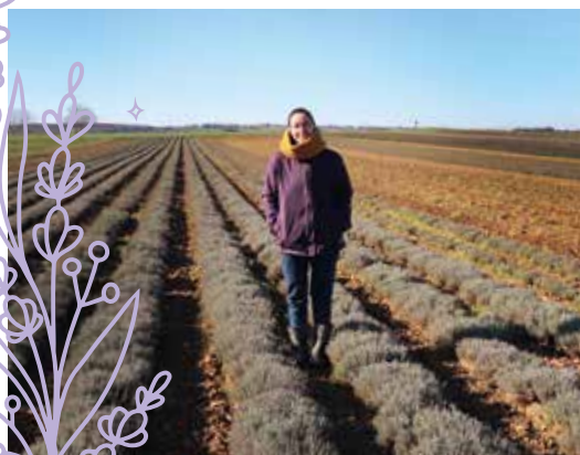
Une culture de plein champ