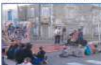
Compagnie Lucernois - spectacle "Le 04 août" / Edition 2014

Pour plus d'information sur ces événements (programmation, dates, horaires, accessibilité des sites...) consultez le blog de la délégation.