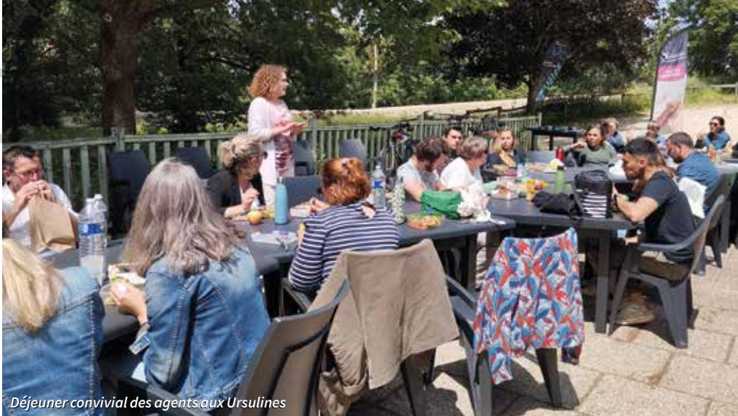
Déjeuner convivial des agents aux Ursulines

Diversité des métiers et des parcours, ouverture aux contractuels, plan de formation, télétravail : les collectivités offrent aujourd'hui de réelles opportunités de carrière. Osez postuler !